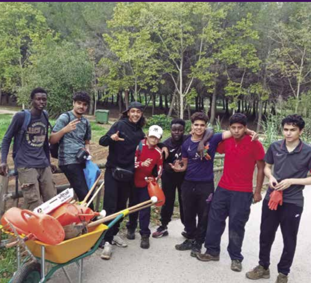
La jardineria i el treball de la terra són eines d'aprenentatge per als joves del PFI.