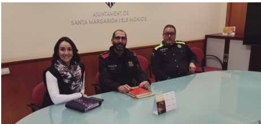
Reunió de l'alcaldesa amb el Cap de Mossos d'Esquadra a la zona i el Cap de la Policia Local..

El servei de policia assistencial i proximitat va registrar 699 intervencions (15%), amb assessoraments i mediacions, queixes i conflictes veïnals o aju-