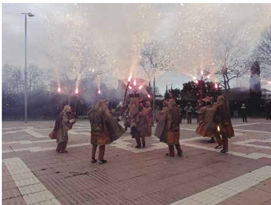
Festa Major d'hivern dels Monjos.