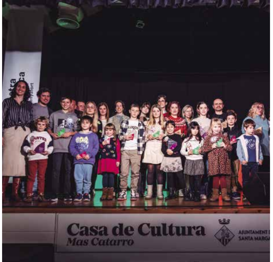
Guanyadors i guanyadores de la Mostra Artística.