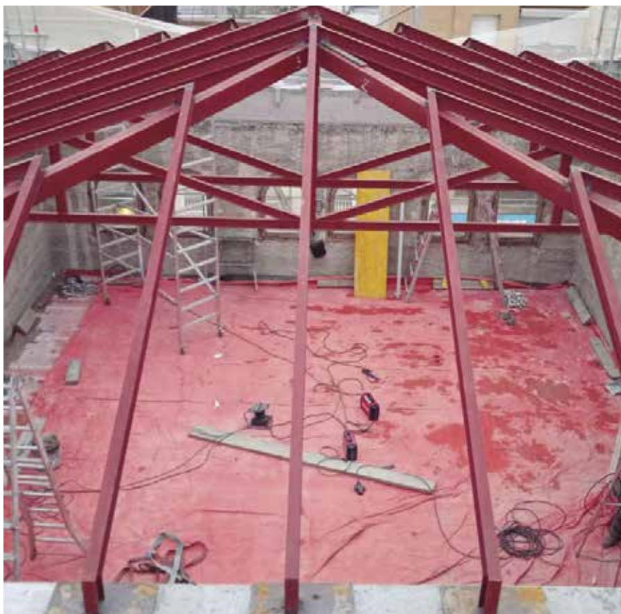
La teulada de l'ajuntament és una de les inversions previstes per al 2025.

Pel que fa a la resta de punts de l'ordre del dia, el ple va aprovar una esmena de l'acta de delimitació amb el terme de Vilafranca del Penedès, amb els vots a favor de PSC, ERC i JUNTS i l'abstenció de PL i PA; i un Pla de Millora Urbana de la zona del Molí d'en Ferran, amb els