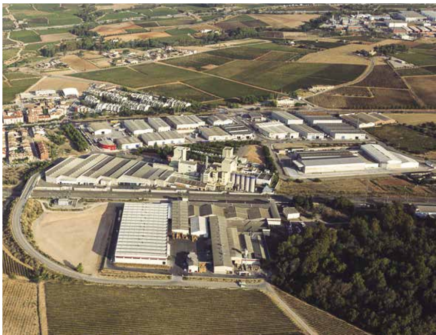
La indústria té un paper fonamental a Santa Margarida i els Monjos.

Durant el mes de gener, dinou persones del municipi han trobat feina. L'atur baixa a Santa Margarida i els Monjos en referència al mes de desembre, 8,84% i es situa al gener al 8,56%. Aquestes xifres reflecteixen una tendència a la baixa, ja que comparativament, ara fa un any que l'atur es situava en el 9,5% al municipi.