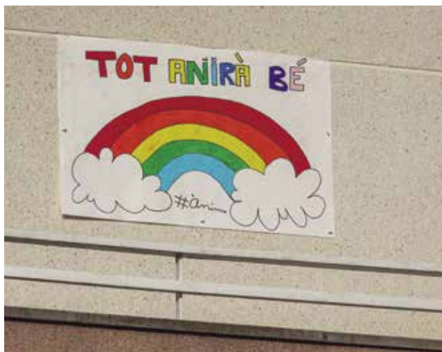
Expressions d'ànims als balcons durant la pandèmia.

La solidaritat també va aflorar entre la societat que, de seguida, es va organitzar per donar suport logístic a les persones grans o vulnerables, fent trucades per fomentar la conversa amb les persones que vivien soles o cosint mascare-