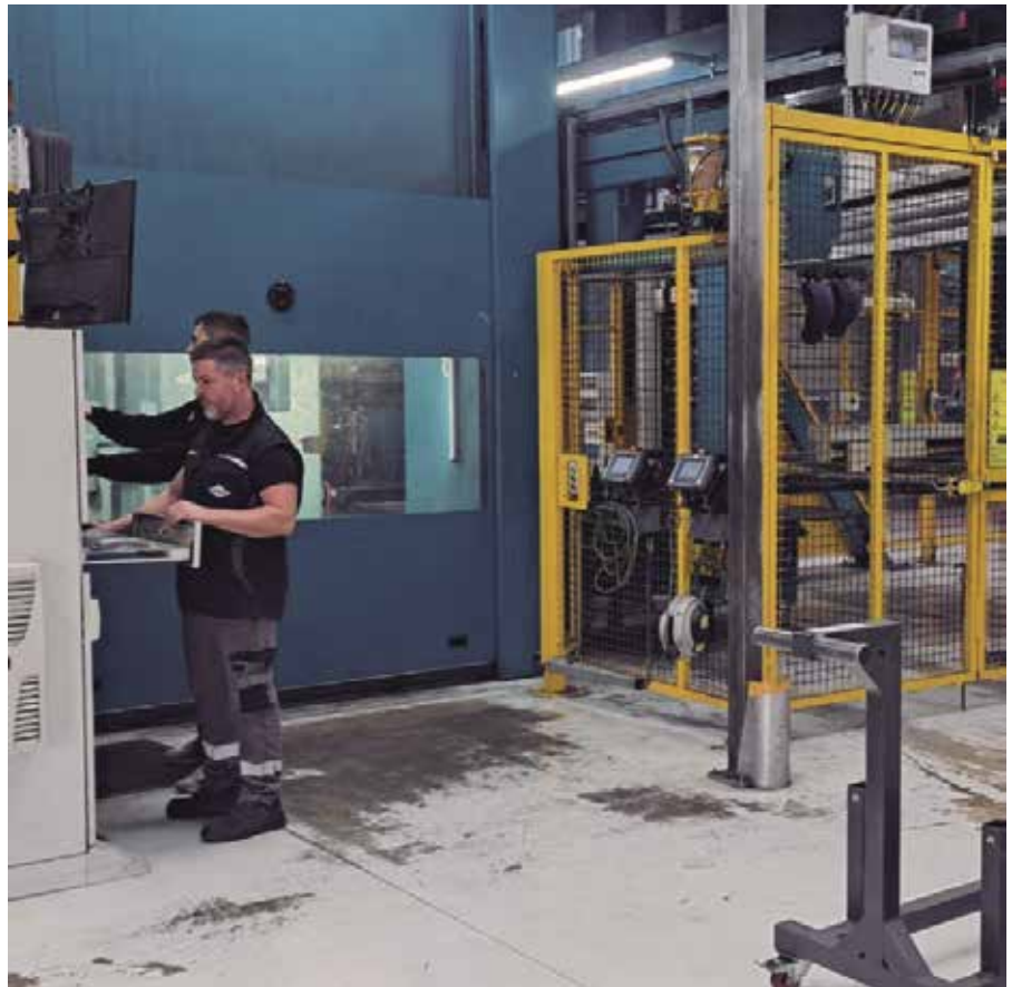
El teixit econòmic és clau al municipi.

En l'àmbit econòmic, es va aprovar el canvi de finançament de les inversions del pressupost municipal 2025, amb els vots a favor de PSC i en contra d'ERC, PL, JUNTS i PA; i les declaracions d'interès especial públic i social per a la construcció del nou CAP situat al C/ Cadí, 1 i per a les obres de col·locació de lamelles de protecció solar a l'institut El Foix, amb bonificacions del 95% de l'impost sobre construccions i exempció de ta-