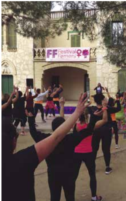
El 8M es commemora el Dia Internacional de les Dones.

A l'institut El Foix també s'han preparat diverses accions per conscienciar el jovent, així com un curs de defensa personal que es durà a terme properament per a l'alumnat de 3r. Als equipaments públics es tornaran a penjar domassos, pancartes i una il·luminació lila especial, com cada any per aquestes dates.